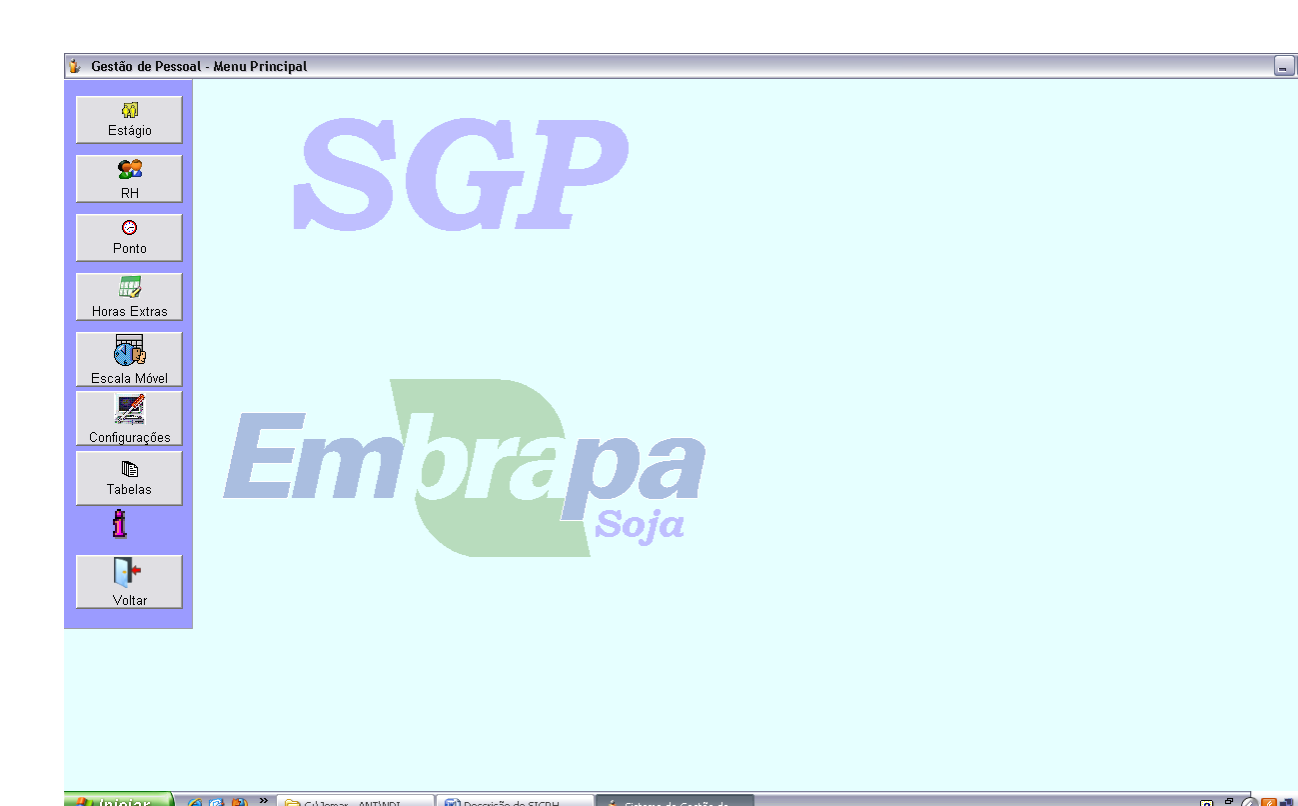
Tela do Menu Principal