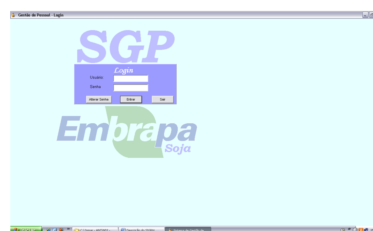
Tela inicial de acesso ao sistema