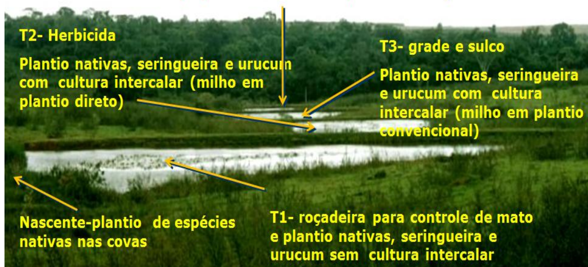
Figura 1. Diferentes tratamentos implantados nos quatro açudes da Voçoroca, Polo Regional Centro Norte- APTA, Pindorama - SP, no ano de 2011

Foram implantadas 32 parcelas distribuídas nas margens dos quatro açudes onde cada tratamento recebeu o nome do açude próximo iniciando-se com o nome do açude1 o açude de cota mais alta próximo as nascente e açude 4 o açude de menor cota próximo à mata.